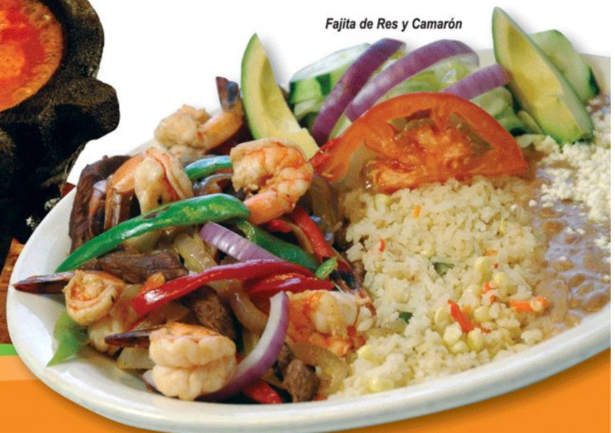
Fajita de Res y Camarón